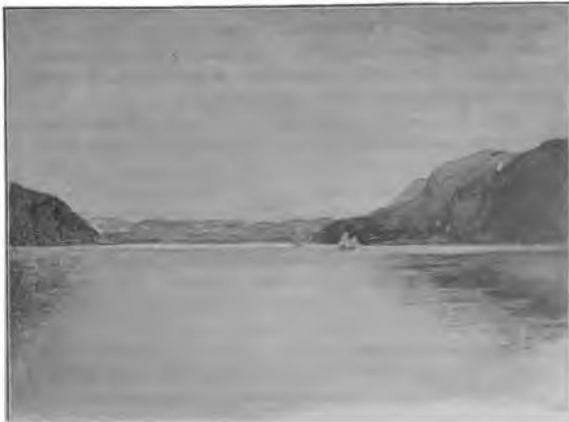
Екатерининская гавань. Рис. К. А. Коровина.

предположение, что наш пейзаж мог быть написан на Мурманском берегу. В XIX веке Кольский полуостров назывался Мурманом, а Мурманским берегом – часть побережья Баренцева моря от Норвежской границы до мыса Святой Нос. Именно вдоль этого берега и проходил маршрут путешествия Коровина и Серова.