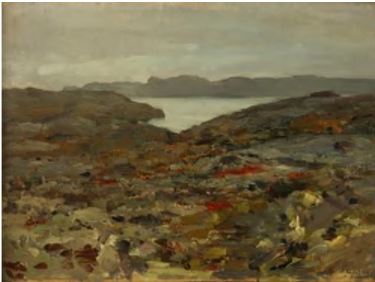
Илл. 1. Коровин К.А. Пейзаж. Холст, масло. 46,5x62,2. НХМ РБ

В коллекции Национального художественного музея Республики Беларусь есть подписная, но недатированная картина Константина Коровина с условным названием «Пейзаж», приобретенная в 1945 году через Государственную закупочную комиссию (Холст, масло. 46,5x62. РЖ-62) (Илл. 1). К сожалению, никакой дополнительной информации о владельцах не сохранилось. Примечательно, что одновременно с «Пейзажем» музей приобрел еще 5 произведений Коровина: «Пейзаж с лодкой», «Париж», «Портрет Й. Риппль-Ронаи», «В засаде», «Гурзуф». Последний происходил из известной коллекции И.К. Крайтора, были ли остальные работы из той же коллекции сегодня остается только предполагать.