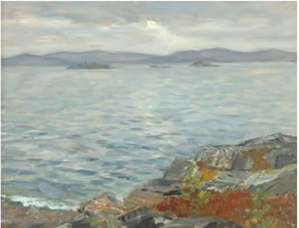
Илл. 2. Бялыницкий-Бируля В.К. Осенний полдень у Белого моря. Заполярье. Этюд. 1933 Картон, масло. 45x58. НХМ РБ

«Пейзаж» удивительным образом напомнил нам этюды К.В. Бялыницкого-Бирули из поездок на Кольский полуостров. Бялыницкий ездил туда в те же месяцы, что и Коровин – в августе – сентябре 1933 года. Оба художника застали раннюю и короткую северную осень, которая часто уже в сентябре сменяется зимой, а снег в сопках зачастую лежит и летом. Поэтому из одной не очень продолжительной поездки можно было привезти пейзажи, представляющие серые краски скал, украшенные красно-оранжевыми пятнами осенних мхов и трав, и наряду с ними – снежные пустыни под низким северным небом. Это, например, «Осенний полдень у Белого моря. Заполярье» 1933 (Картон, масло. ЖБ-224. НХМ РБ) (рис. 2) и «Поморский поселок. Заполярье. Этюд» 1933 (Картон, масло. ЖБ-219. НХМ РБ) В.К. Бялыницкого-Бирули и «Ручей св. Трифона в Печенге. Лапландия» 1894. (Холст, масло. Инв. 1506 ГТГ) (Илл. 3) и «Зима в Лапландии» 1894 (Дерево, масло. Инв. 1507. ГТГ) (Илл. 4) К.А. Коровина.