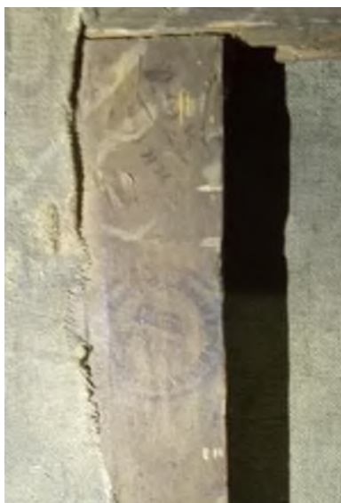
Илл. 16. Штамп Аванцо на подрамнике картины И.Е. Крачковского «Пейзаж с речкой». НХМ РБ

Образцы штампов магазина Аванцо, найденные в интернете, обнаруживают преобладание штампов и наклеек на оборотах подрамников.