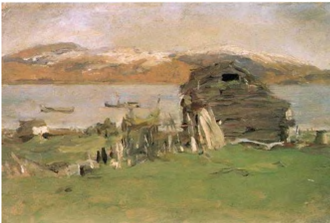
Илл. 8. Серов В.А. На Мурмане. Бухта Трифона Печенгского. 1894. Этюд из путешествия на Север. Дерево, масло. 16x22. ГТГ

Изначальное предположение, что изображен залив Св. Трифона, в котором Коровин и Серов останавливались надолго, сходство нашего пейзажа с работой из ГТГ, изображающей ручей Св. Трифона, сравнение с этюдом Серова, изображающем те же места (Илл. 8), даже сходство форматов нашего этюда и третьяковского, к сожалению, не могут служить доказательной базой.