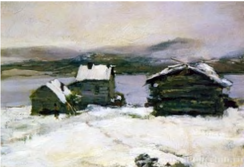
Илл. 4. Коровин К.А. Зима в Лапландии. 1984. Этюд из путешествия на Север. Дерево, масло. 23,5x33. ГТГ

В 1890-х годах К.Коровин предпринял несколько, а точнее четыре, поездки на Север России. Первая поездка состоялась в августе–сентябре 1894 года совместно с В.А. Серовым; вторая – в период с августа до конца октября 1895 года с Н.А. Праховым и Н.В. Досекиным. Летом 1897 года Коровин, в компании В.А. Серова, ездил в Архангельск, участвовал в создании иконостаса в г. Александровске в Екатерининской гавани на Мурмане. В мае–июне 1898 года состоялась еще четвертая поездка на Север с Н.А. Клодтом. Красочный строй нашего пейзажа, несомненно, представляет