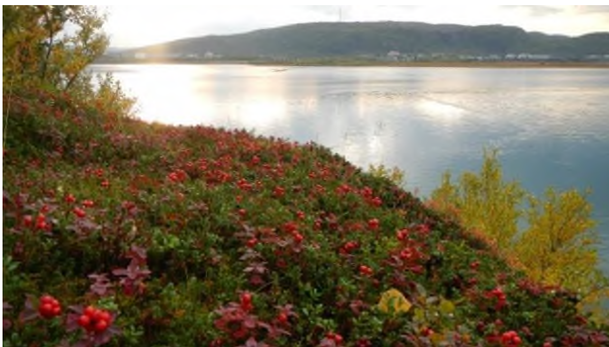
Илл. 6. Сентябрь на Кольском полуострове.

Попытка найти репродукцию нашего пейзажа в периодике того времени пока успехом не увенчалась. Каталог выставки МОЛХа, на которой экспонировались этюды, не дает точного перечня этюдов (только названия картин). Более 20 этюдов из этой поездки были опубликованы в качестве иллюстраций в книге Е.Л. Львова «По студенному морю: Поездка на Север», вышедшей в 1895 году и описывающей экспедицию Витте (Илл. 7). Среди опубликованных этюдов схожего с нашим не нашлось. Однако, лаконичность живописной манеры и сами северные ландшафты позволяют сделать