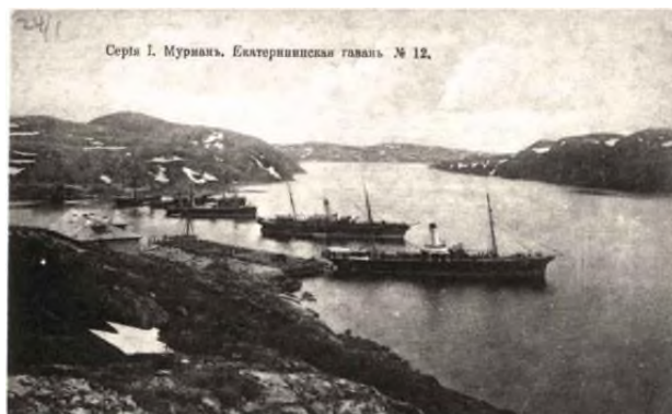
Илл. 11. Екатерининская гавань. Рубеж XIX-XX вв.

На обороте холста нашей работы в левой верхней четверти есть надпись черной краской: Б.498 / ZGA-VZZ / Б. АВАНЦО / МОСКВА. (Илл. 11)