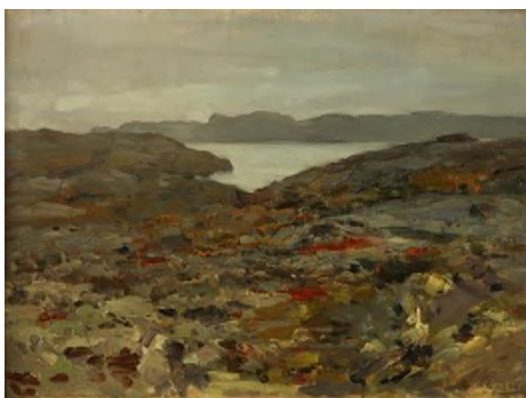
Илл. 10. Коровин К.А. Пейзаж. Холст, масло. 46,5x62,2. НХМ РБ