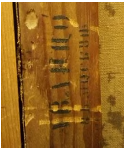
Илл. 14. Штамп Аванцо на подрамнике картины В.Е. Маковского «Поздравление с ангелом». НХМ РБ

сторон на раме), но на обороте этюда И.И. Шишкина «Осока» сохранилась очень похожая надпись (рис. 12), расположенная также в левой верхней четверти.