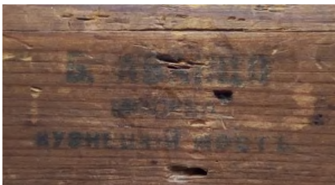
Илл. 15. Штамп Аванцо на подрамнике этюда Н.В. Неврева «Голова девушки». НХМ РБ