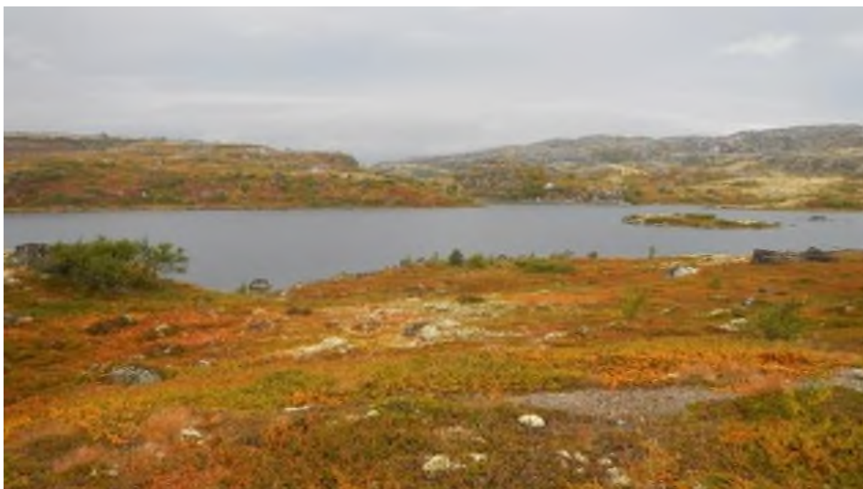
Илл. 5. Печенгская губа. Осенние краски Кольского полуострова.

осеннюю тундру (Илл. 5, 6). На основании этого датировка может быть сужена до 1894–1895 годов, т.к. обе поездки захватывали осенние месяцы.