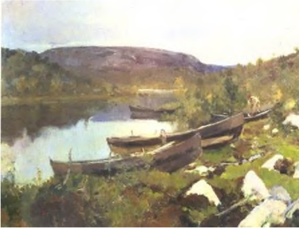
Илл. 3. Коровин К.А. Ручей св. Трифона в Печенге. Лапландия. 1894. Этюд из путешествия на Север. Холст, масло. 46,8x64. ГТГ