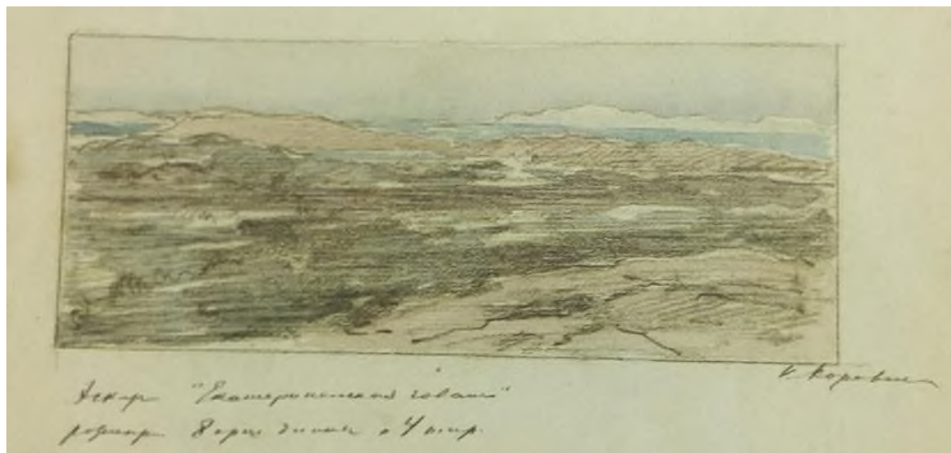
Илл. 9. Коровин К.А. Екатерининская гавань. Лист из альбома эскизов. ГТГ

В альбоме эскизов Коровина к оформлению павильона Крайнего севера, хранящемся в ГТГ, есть эскиз под название «Екатерининская гавань» (Илл. 9). Характер ландшафта, компоновка «объектов» в формат эскиза напоминают наш пейзаж. Можно сделать предположение, что наш этюд, выполненный с натуры в Екатерининской гавани, мог лечь в основу переработанного, осмысленного более общо большого панно для павильона Крайнего Севера.