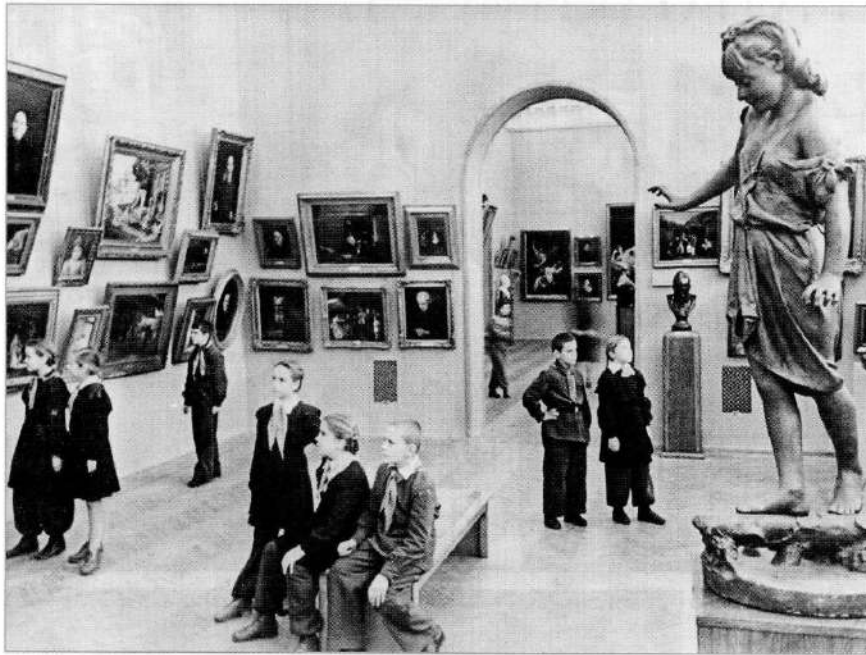
Школьнікі – наведвальнікі Дзяржаўнага мастацкага музея БССР. 1958 г.

Рэкламны плакат можна было выкарыстоўваць як постар і як кароткі даведнік.