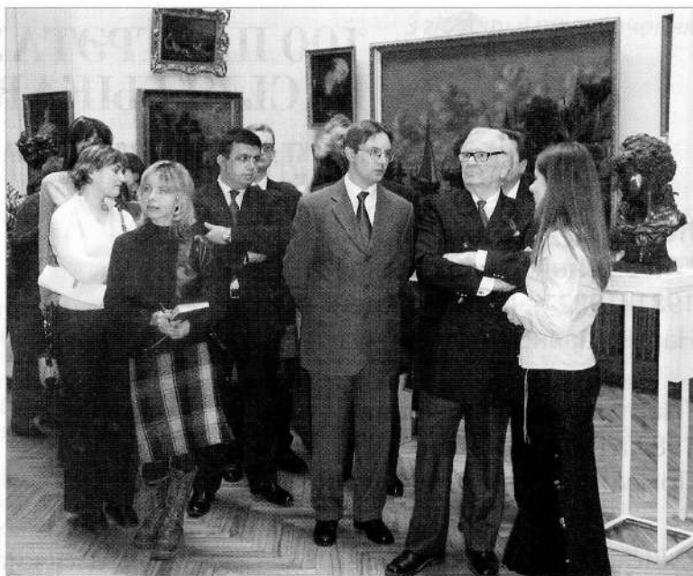
П'ер Кардэн (другі справа) падчас наведвання Нацыянальнага мастацкага музея Рэспублікі Беларусь. 2004 г.

Паступова сфарміраваўся і фонд музейных фотаздымкаў. З канца 1950-х гг. у музеі працавалі прафесійныя фатографы Ісак Салавейчык, Юрый Іваноў, Алег Ліхтаровіч, Вячаслаў Петрачэнкаў, Дзмітрый Казлоў. У іх абавязкі ўвахо-