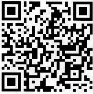
Спіс літаратуры даступны па qr-кодзе.

Дзве апошнія шаўкаграфіі, магчыма, – самастойныя працы. Нам не ўдалося выявіць ні жывапісных, ні графічных (акварэль, гуаш, малюнак алоўкам) твораў, чые кампазіцыі цалкам паўтараліся б у гэтых гравюрах.